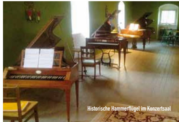
Historische Hammerflügel im Konzertsaal

Freier Eintritt. Spenden für Schloss Seehaus e. V. erbeten.