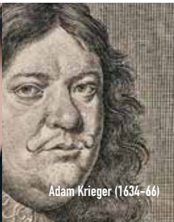
Adam Krieger (1634–66)