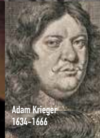
Adam Krieger 1634-1666