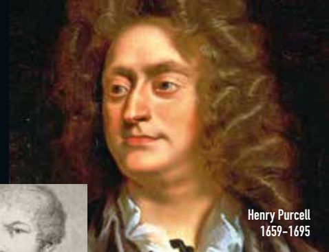
Henry Purcell 1659-1695