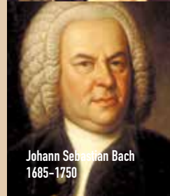
Johann Sebastian Bach 1685-1750