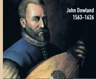
John Dowland 1563-1626