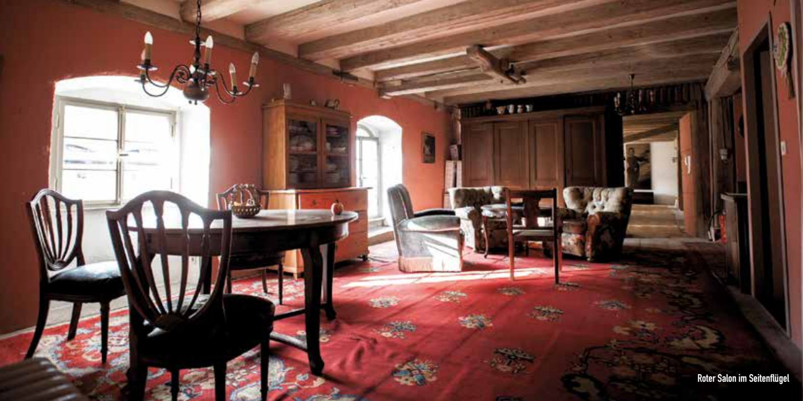
Roter Salon im Seitenflügel