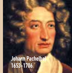
Johann Pachelbel 1653-1706